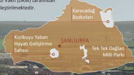
Tek Tek Dağları Milli Parkı

Projenin bozkır biyolojik çeşitliliğinin geniş peyzajlarda etkin korunması için uygun ortamın oluşturulması bileşeni kapsamındaki çalışmalar Doğa Koruma Merkezi Vakfı (DKM) tarafından gerçekleştirilmektedir.