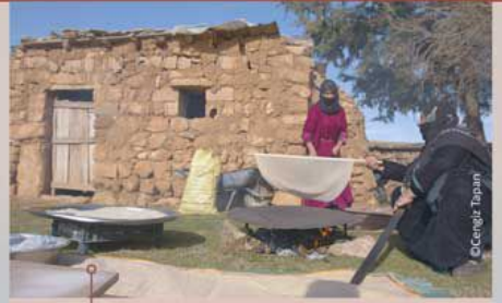
Yağmurlu Mahallesi'nden kadınlar ekmek yaparken

Şanlıurfa ili, Türkiye'de bozkır denilince ilk akla gelen yerler arasındadır. Uçsuz bucaksız düzlükleri, yarı-kurak iklimi ve sade topoğrafik yapısıyla Şanlıurfa'daki doğal bitki örtüsü büyük ölçüde bozkırlardan oluşmaktadır.